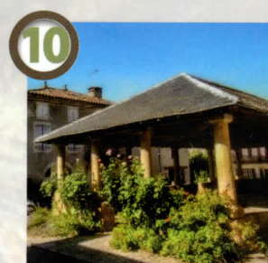
Halle du village de Verfeil