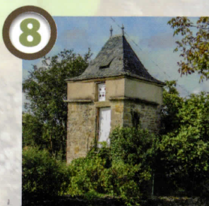
Pigeonnier du hameau de Dreuilhe