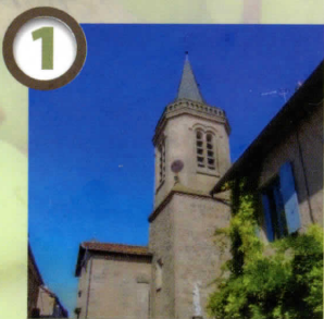
Eglise de Verfeil