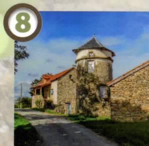
Maison du hameau de Dreuilhe