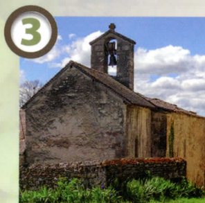
Chapelle de Paulhac