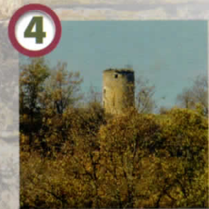
Ruine du moulin de Pech Poujol