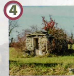
Puits couvert de Burguet