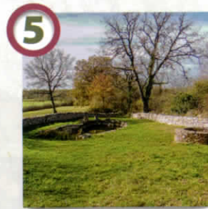
Mare-lavoir de Genebrières