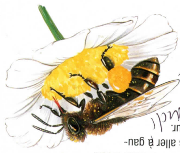
ABELLE / DESSIN P.R.