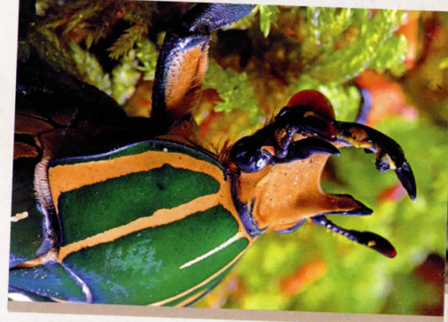
MICROPOLIS « LA CITÉ DES INSECTES » / PHOTO PHOTOGRAPHIQUE DE MICROPOLIS

palais pour les insectes : « Micropolis ». Sur une surface couverte de 2 400 m 2 , cette cité offre quinze espaces d'expositions permanentes, chacun dévolu à un thème entomologique précis. De vivariums en reconstructions spectaculaires, on chemine dans des insectes ». Grâce à des technologies les plus modernes, le visiteur peut observer de près le comportement fascinant du petit peuple des insectes dans son milieu naturel. Il peut aussi participer à d'étonnantes expériences mettant en présence l'homme, l'insecte et la plante. Micropolis est un véritable lieu magique pour assister au défilé de mille couples d'insectes.