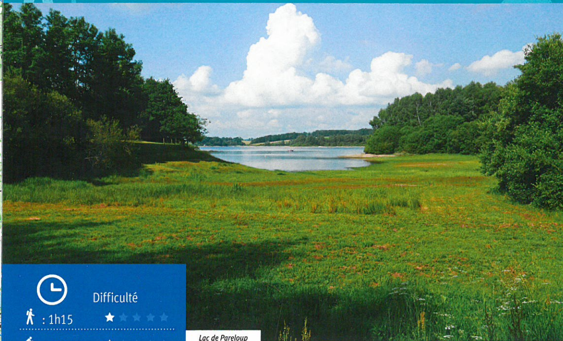
Lac de Pareloup